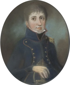
J.169.152 Officier de la Garde nationale, pstl, 55x44 (Besançon, Dufreche, Chaprais, 21.VI.2012, Lot 100 repr., éc. fr. XIX e , est. €100–150) [new attr., ?] φαν