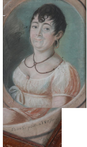
J.169.161 Dame, pstl/ppr, 56x4 (Génicourt, Cergy-Pontoise, 13.XI.2025, Lot 142 repr., éc/ fr. XIX e , est. €10–20) [new attr.] φν