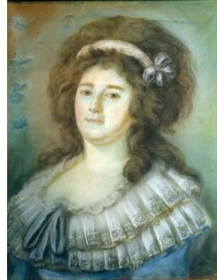
J.169.1533 Femme au bonnet, pstl/ppr, 52x41, sd verso “Boos: pinte/à 1795” (Paris, Art Research Paris, 22.II.2026, Lot 52 repr., éc. fr., est. €80–120) [new attr.] φν