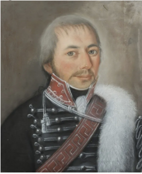
J.169.1495 Officier de l'Artillerie à cheval, pstl, 20x18 ov., c.1806 (Paris, Phidias, 26.1.2023, Lot 133 repr., anon. XIX e , est. €400–50) [new attr., ?] φαν