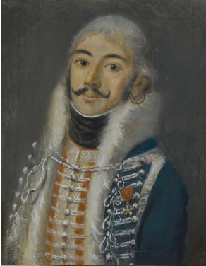
J.169.139 J.169.14 Deux officiers du 8 e régiment de hussards, pstl, 1803 (PC 2012). Lit.: Noubel 2012, fig. 24/25 repr. φ