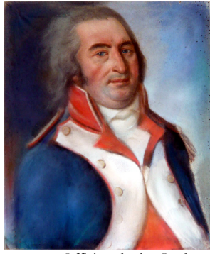
J.169.1521 Officier de la Garde nationale, pstl, 58x47 (PC 2018) [attr.] φα