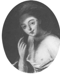
J.95.1209 Jeune femme en allégorie, 41x33 ov., c.1769 (Warsaw, Muzeum Narodowe, inv. NB 216. Radziwill at Nieborow). Lit.: Waniewska 1993, no. 104 φ