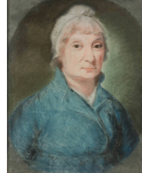
J.95.1227 Femme, pstl, 36.5x31, c.1794 (Warsaw, Muzeum Narodowe, inv. 72620). Lit.: Waniewska 1993, no. 119, inconnue; Warsaw 2015, p. 46 repr., as by Kucharski [??] φ