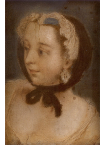
J.95.12285 Young woman in winter cap and muff, pstl/ppr, 41x30.5 (Wilanów, inv. Wil.1470). Lit.: Gutowska-Dudek 2019, pp. 148f repr., as ?a/r Rotari [?]; pastiche in manner of Coypel] φ