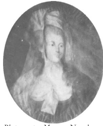
J.95.1218 Dame, 62x52 ov., c.1790 (Warsaw, Muzeum Narodowe, inv. 182988. Dep. Maurycz Potocki). Lit.: Waniewska 1993, no. 113 φ