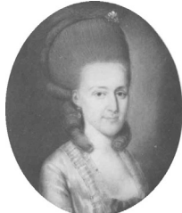
J.95.1215 Dame, 27.5x22.5 ov., c.1778 (Warsaw, Muzeum Narodowe, inv. 129737). Lit.: Waniewska 1993, no. 107, as Polish sch. [cf. J. P. Bardou] φ