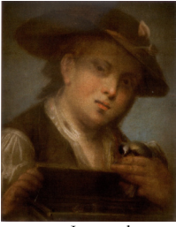
J.95.1192 Jeune homme, pstl/pchm, 53x43.5, c.1796 (Warsaw, Muzeum Łazienki Królewskie) φ