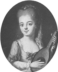
J.95.1203 Jeune femme avec guitare, 41x33 ov., c.1769 (Warsaw, Muzeum Narodowe, inv. NB 211. Radziwill at Nieborow). Lit.: Waniewska 1993, no. 102 φ