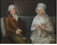
J.95.1237 “Half a dozen pretty good heads large as life in crayons”, seen by Jeremy Bentham at a coffee-room at ?Gottslovski [?Goclaw], 3½ miles distant but one short (between Kooberna and Warsaw) of Warsaw, Diary of a journey from Krichén to Warsaw , 30.XI.1787