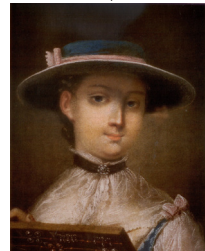
J.95.12295 Young woman in a white cap with blue ribbons, pstl/ppr, 45x35 (Wilanów, inv. Wil.1621). Lit.: Gutowska-Dudek 2019, pp. 148f repr., as style of Rotari φ