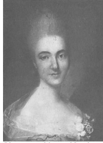
J.95.1212 Dame, 54.5x41, c.1770 (Warsaw, Muzeum Narodowe, inv. NB 950. Radziwill at Nieborow). Lit.: Waniewska 1993, no. 106, circle of Louis Marteau φ