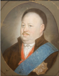
J.95.1199 Chevalier de l'Aigle blanc, pstl (Paris, Drouot, Boisgirard, 17.VII.2009) φ