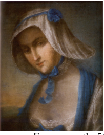
J.95.123 Femme, pstl, 51x41 (Stanislaw August a.1817). Lit.: Mańkowski 1932, no. 1458 n.r.