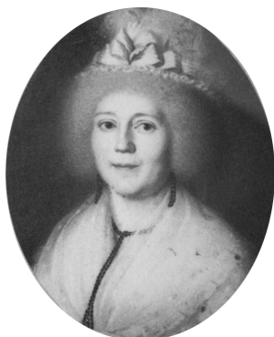
J.343.147 Unbekannte Mann im Pelz; & pendant: J.343.148 Frau, pstl/ppr, 38x33 ov., sd "C. Geiger pinxit 1801" (Inning, Ammersee PC 1990). Lit.: Schneider 1990, no. 166/167 repr. φ