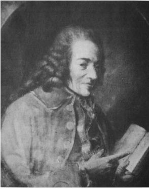
J.124.141 ~version, pstl (Paris, .VII.2001, as inconnu, anon., n.r.)