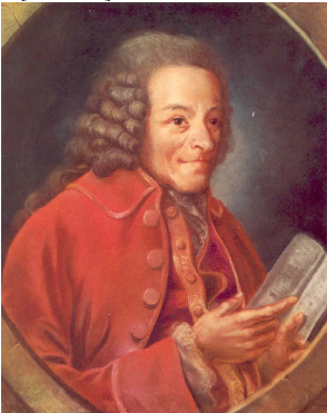
J.124.144 ~version, Voltaire lisant Sophocle, pstl, 63x53 ov. (Paris, Drouot, Delorme, Collin du Bocage, 21.III.2007, Lot 53 repr., as by Huber, est. €12–18,000; Paris, Drouot, Delorme, Collin du Bocage, 23.XI.2007, Lot 10 repr., est. €10–15,000, b/i; Paris, Drouot, Delorme, Collin du Bocage, 12.XII.2008, Lot 584 repr., est. €5–8,000; Paris, Drouot, Delorme, Collin du Bocage, 16.XII.2009, Lot 5 repr., est. €3–4,000) [new attr.] φα