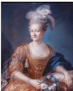
P. Barat peint 1775