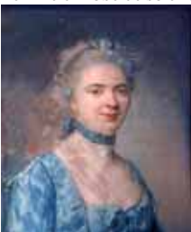
Femme, ruban au col