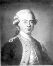
Arnail-François, marquis de JAUCOURT