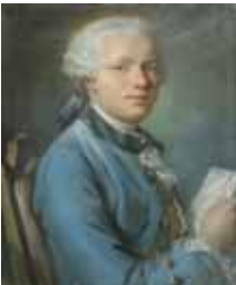
??Le marquis de MARIGNY