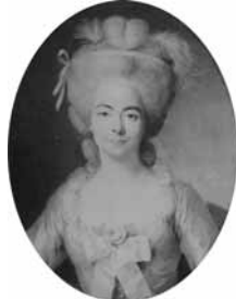
Jeune femme à la robe bleue