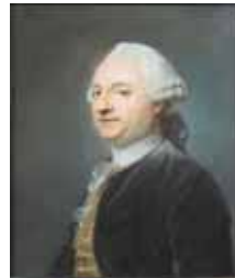
Homme en habit noir, gilet rose