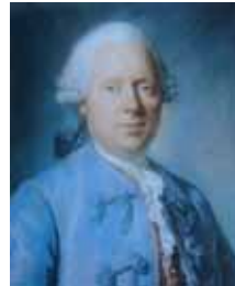
Homme en habit bleu