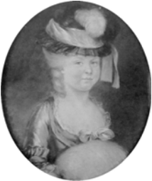
Fillette au chapeau noir à plumes