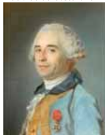
Un chevalier de Saint-Louis