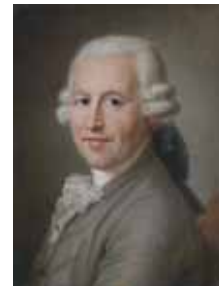
Homme en habit brun