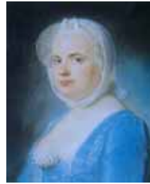
Dame en robe bleue