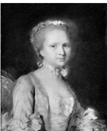
Femme en robe de soie rose