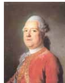
Nicolas-Philippe LEDRU, dit Comus