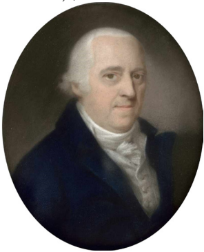
J.778.143 Nobleman in a dark blue uniform, pstl/pchm (Amsterdam, Christie's, 21.III.1999, Lot 35 n.r., in group, est. D/f8–12,000)