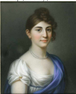
J.778.147 Lady, pstl/pchm (Amsterdam, Christie's, 21.III.1999, Lot 35 n.r., in group, est. D/f8–12,000)