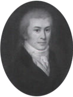
J.778.142 Ein Mannsbild, a/r van Dyck, pstl, Berlin 1787, no. 166