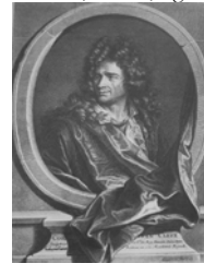
Villars, v. Kökenyessdi von Vetes

~grav.: J.-B. Poilly, 1714. Lit.: Börsch-Supan 1963, no. 25, fig. 51