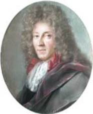
Homme à grande perruque, pstl, 81x60 ( olim Orléans, mBA, inv. 1142. Don Fourché; lost a.1945). Lit.: Klinka-Ballesteros 2005, no. 92 n.r.