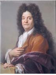
Jeune homme, pstl, 51x41, sd 1700 (Zurich, Galerie Koller, 25.XI.1977, Lot 5402/3, Swfr5000)