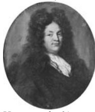
Homme, de ¾ vers la g., pstl, 59x49 (Paris, Drouot, 3.XI.1982, Lot 50 repr., attr., est. Fr8–10,000) [?attr.; cf. Coypel] Φ