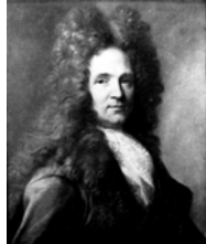
Homme, pstl, 74x60 ov. (Versailles, Palais des congrès, Chapelle, Perrin, Fromantin, 7.IV.1974, Lot 42 repr., attr., Fr4000) Φ