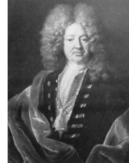
Homme en habit noir, manteau rouge, pstl, 80x65.5 (London, Christie's, 18.XII.1987, Lot 108 repr., circle of Vivien, est. £5–8000) Φ