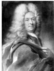
Officier en cuirasse, pstl, 72x59 ov. (Paris, Drouot, 14.VI.1946, Lot 26 n.r., attr.)