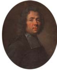
Homme, pstl, 65x54.1 ov. (Mme Saint-Sauveur; Paris, Remy, 12.II.1776 & seq., Lot 48)