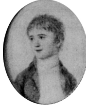
Waldenburg; lost). Lit.: Vogel & Vogel von Vogelstein 2006, p. 151 repr. \phi