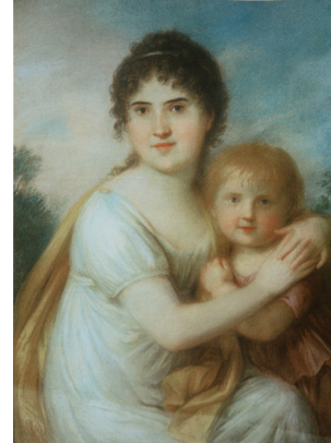
1.772.137 ~repl., pstl, 61x50, 1802 ( olim Schloß Waldenburg) \phi