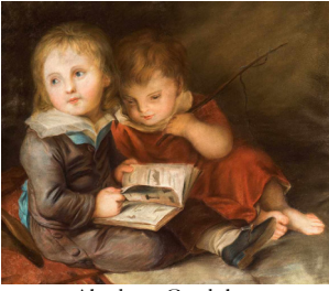
J.1772.168 Abraham Gottlob WERNER (1749–1817), Mineralog und Geolog, pstl (Dresden, Mineralogisch-Geologisches Museum). Lit.: Vogel & Vogel von Vogelstein 2006, p. 151 repr. φ