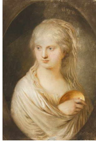
J.1772.184 Eine Vestalin, pstl/pchm, 51.5x36.5, s verso (Heidelberg, Winterberg, 13.v.2017, Lot 148 repr., est. €780) φ