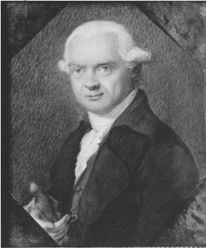
J.1772.17 Portrait, pstl. Exh.: Dresden 1775. Lit.: Vogel & Vogel von Vogelstein 2006, p. 132