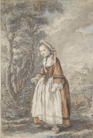
~grav. J. Daullé 1754, Salon de 1755, no. 169, "d'après le dessin de M. Carle Vanloo" (FD 332). Lit.: Laine & Brown 2006, fig. 47; Baetjer 2019, fig. 70.1, as of original

J.745.1205 Mme FAVART, graphite, cr. clr/pchm, 47.3x32.1 (comte de La Béraudière; Paris, 18.V.1885, Lot 162; L. Tabourier; Paris, Drouot, Chevallier, 20–22.VI.1898, Lot 131, H2000; Roblin; Mme Réjane, de la Comédie française; Condé Nast; New York, Parke Bernet, 17.I.1943, Lot 366, $350. New York, Sotheby Parke Bernet, 3.XI.1972, Lot 98, $725; Emile Wolf, New York; desc.: New York, Sotheby's, 31.I.2018, Lot 177 repr., est. $6–8000, $11,000). Exh.: Cambridge 1980, no. 38/Vienna 1988, no. 80. Lit.: Vanloo 1977, no. 297 repr.; La Tour 2004a, p. 174 fig. 1 (suggesting head based on La Tour J.46.1758) φ