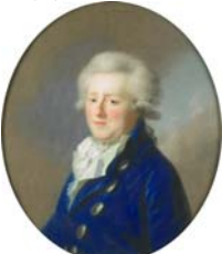
KARL GEORG August Erbprinz von Braunschweig ~cop., pstl, 38x29 ov. (Kgl. Haus Hannover; Ernst-August Penzing inv. 4383; Schloß Marienburg, Sotheby's, 8.X.2005, Lot 1776 repr., est. €600–900) \Phi