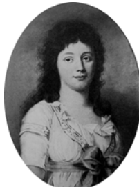
Gräfin Augusta von BISMARCK, née Prinzessin von Nassau-Usingen (1778–1846), pstl, 64x47.5 (Arolsen, Stiftung des Fürstlichen

Hauses zu Waldeck u. Pymont, Residenzschloß)