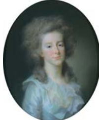
Frederike LOUISE Wilhelmine Erbprinzessin von Braunschweig-Wolfenbüttel, née Prinses van Oranje Nassau (1770–1819), Gemahlin von Erbprinz Karl Georg August, pstl/vl, 60.5x48.5 ov., 1785–95 (Rijksmuseum inv. A415. National Konst Gallery, The Hague, a.1808). Lit.: Thiel 1976; Bolomey 2001, fig. 24 \Phi