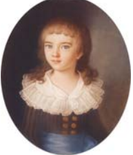
KARL FRIEDRICH Erbprinz von Sachsen-Weimar (1783–1853), pstl, 71x56 ov., 1804 (Weimar, SWKK, inv. KGe/00173). Lit.: Wahl 1927, p. 15 repr. \Phi