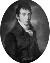
KARL GEORG August Erbprinz von Braunschweig (1766–1806), pstl, 66x55 ov., sd \checkmark "Tischbein/1792" (Braunschweig, Herzog Anton Ulrich-Museum, 681). Exh.: Berlin 1906, no. 3261 n.r. Lit.: Jacoby 1986, p. 239 repr.; Jacoby 1987, fig. 10 \Phi