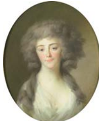
LUISE Isabella Alexandrina von Nassau-Weilburg, née von Sayn-Hachenburg-Kirchberg (1772–1827), pstl/vl, 60.5x48.5 ov. (Rijksmuseum SK-A-416. National Konst Gallery, The Hague, a.1808). Lit.: Thiel 1976 \Phi