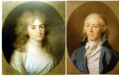
AUGUSTA Maria Carolina von Nassau-Weilburg (1764–1802), pstl/vl, 61.5x50 ov., 1785–95 (Rijksmuseum SK-A-410. National Konst Gallery, The Hague, a.1808). Lit.: Thiel 1976 Φ