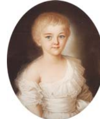
Fürst FRIEDRICH Karl August von Waldeck u. Pymont (1743–1812), pstl, 51x41 (Arolsen, Stiftung des Fürstlichen Hauses zu Waldeck u. Pymont, Residenzschloß)