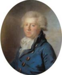
~variant, pstl/vl, 62.5x52 ov., 1785–95 (Rijksmuseum SK-A-411) \Phi