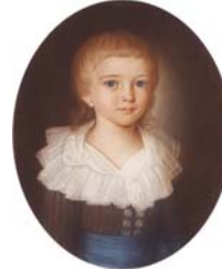
Frederike Luise WILHELMINE van Oranje-Nassau, née von Preußen (1774–1837), pstl/vl, 61.5x49.5 ov. (Rijksmuseum inv. SK-A-413, cat. no. 2959. National Konst Gallery, The Hague, a.1808). Exh.: Rotterdam 1946, no. 73 n.r. Lit.: Brieger 1921, p. 62; Thiel 1976 \Phi