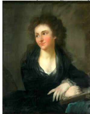
Biron von Kurland, v. Dorothea

J.697.101 SELBSTPORTRÄT, pstl, 71x56, 1791 (Leipzig, Stadtgeschichtliches Museum, inv. K/12/2001). Lit.: Siegel 1983, fig. 3 φ