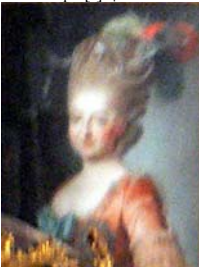
MARIE-Josèphe de Saxe (1731–1767)

~cop., pstl (Rome, Palazzo di Venezia), as by Lampi [?] φ