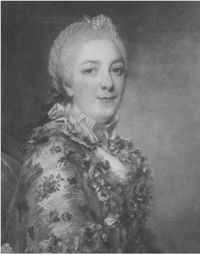
J.629.196 ~cop., ??La duchesse de CHEVREUSE, née Pignatelli, pstl, 56x46 (château d'Esclimont 1999) φκσν