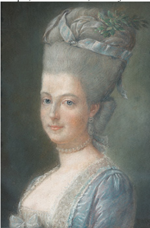
J.629.251 ~cop., with different costume, pstl, 65x49 (PC 2013; Vienna, Dorotheum, 3.V.2023, Lot 126 repr., est. €7–10,000) φκ