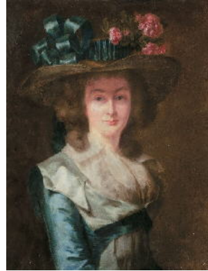
J.629.265 ~cop., pstl/ppr, 66x49.5 (Swiss PC; Köln, Lempertz, 19.V.2007, Lot 1347 repr., attr. Alexandre Roslin, est. €6–7000, b/i) [??attr.] φκ