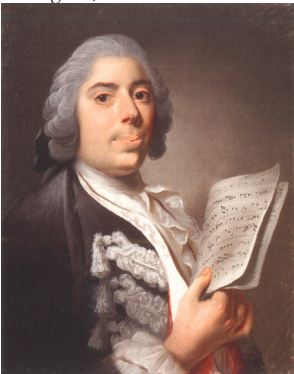
J.629.202 Musicien, pstl, 59x50, c.1746 (Bayreuth, Neues Schloß). Lit.: Lundberg 1957, no. 29 n.r.