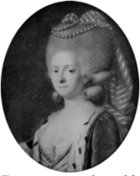
Femme au ruban bleu, pstl, 46x33 (Paris, Drouot, Millon & Robert, 30.III.2004, Lot 18 n.r., Éc. fr. c.1770, entourage d'A. Roslin, est. €1000–1500, €1900)