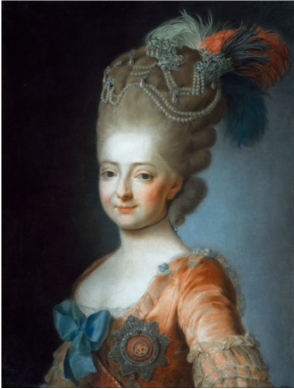
MARIE CHRISTINE Joséphe Herzogin von Sachsen-Teschen, née Erzherzogin von Österreich (1742–1798), gouvernante des Pays-Bas, pnt. (PC). Exh.: Vienna 1980, no. 46,01 repr. =?pnt., 1778 (Vicar Christensen, Stockholm). Lit.: Lundberg 1957, no. 483 ~grav. Bartolozzi ~repl., pnt., 119x91 (London, Sotheby's, 9.XII.1992, Lot 207 repr.) J.629.249 ~cop., with different costume, pstl, 30.5x26 (Staatl. Kunstsammlungen Dresden; Amsterdam, Sotheby's, 16–17.X.2001, Lot 411 repr., German sch., est. D f/800–1200) φκ