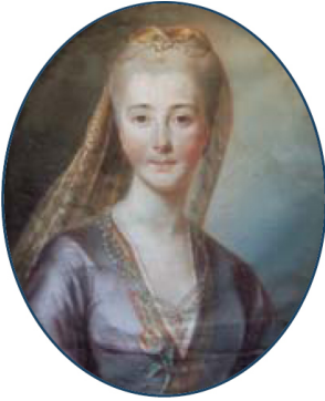
MARIA FEDOROVNA, ∞ Tsar Paul I, née Sophia Dorothea Augusta Louisa von Württemberg (1759–1828), pnt., 1777 (Stockholm) ~version (Pavlovsk) J.629.243 ~cop., pstl (Rome, Palazzo di Venezia), as by Lampi [?] φκ