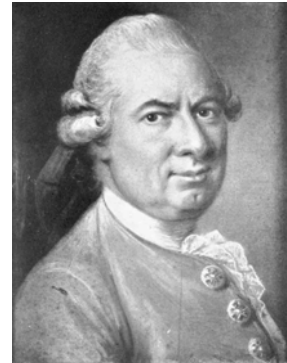
Pierre-Joseph ALARY (1690–1770), de l'Académie française 1723, précepteur de Louis XV, m/u (famille PC 1891). Lit.: Clément 2002, pl. 2, p. 127 [new attr., ?] ◊

AUTOPORTRAIT en habit gris, pstl (Mlles Sainte-Marie Goupil 1946). Lit.: Ratouis de Limay 1946, pl. LXIII/96 ◊