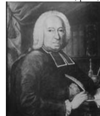
~repl., pstl, 63x53 (Louvre 35159; dep.: Châteauroux, musée-hôtel Bertrand, 1923, D.342, as by Baze. Don de l'Académie française au roi, 1839). Lit.: Monnier 1972, no. 132 [new attr., ?] ◊