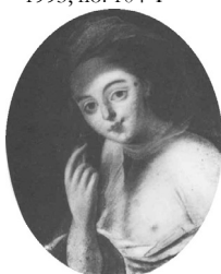
J.95.1209 Jeune femme en allégorie, 41x33 ov., c.1769 (Warsaw, Muzeum Narodowe, inv. NB 216. Radziwill at Nieborow). Lit.: Waniewska 1993, no. 104 φ