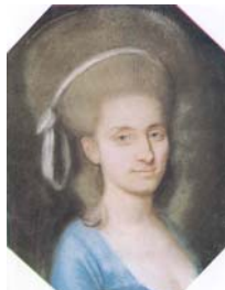
Dame, 62x52 ov., c.1790 (Warsaw, Muzeum Narodowe, 182988. Dep. Maurycz Potocki). Lit.: Waniewska 1993, no. 113 ◊