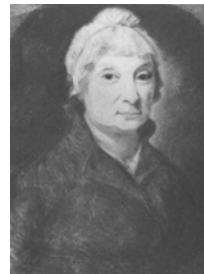
Femme, pstl, 51x41 (Stanislaw August a.1817). Lit.: Mánkowski 1932, no. 1458 n.r. Dame inconnue ayant les mains liés, pstl, 56x46 (Stanislaw August a.1817). Lit.: Mánkowski 1932, no. 2277 n.r.