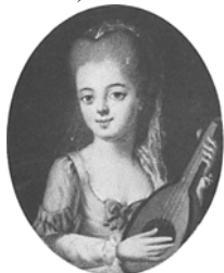
Jeune femme en Diane, 41x33 ov., c.1769 (Warsaw, Muzeum Narodowe NB 230. Radziwill at Nieborow). Lit.: Waniewska 1993, no. 103 ◊

Jeune femme avec guitare, 41x33 ov., c.1769 (Warsaw, Muzeum Narodowe NB 211. Radziwill at Nieborow). Lit.: Waniewska 1993, no. 102 ◊