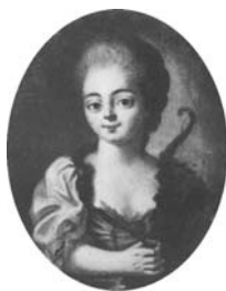
Jeune femme en allégorie, 41x33 ov., c.1769 (Warsaw, Muzeum Narodowe NB 216. Radziwill at Nieborow). Lit.: Waniewska 1993, no. 104 ◊