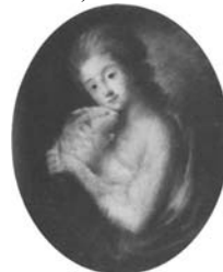
Jeune fille en Vénus avec Amour, 63x52.5 ov., c.1790 (Warsaw, Muzeum Narodowe 183673. Dep. Maurycz Potocki). Lit.: Waniewska 1993, no. 115 ◊