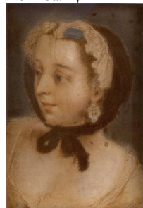
J.95.12285 Young woman in winter cap and muff, pstl/ppr, 41x30.5 (Wilanów, inv. Wil.1470). Lit.: Gutowska-Dudek 2019, pp. 148f repr., as ?a/r Rotari [?]; pastiche in manner of Coypel] φ