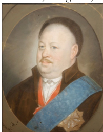
J.95.1199 Chevalier de l'Aigle blanc, pstl (Paris, Drouot, Boisgirard, 17.VII.2009) φ