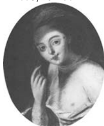
Dame, 54.5x41, c.1770 (Warsaw, Muzeum Narodowe NB 950. Radziwill at Nieborow). Lit.: Waniewska 1993, no. 106, circle of Louis Marteau ◊