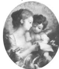
Femme, 36.5x31, c.1794 (Warsaw, Muzeum Narodowe 72620). Lit.: Waniewska 1993, no. 119 ◊