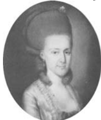
Dame, 37x31 octagonal, c.1779 (Warsaw, Muzeum Narodowe 72817. Don Karolina Wereszczakowa, 1925). Lit.: Waniewska 1993, no. 108 ◊