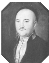
Jeune homme en habit bleu, 27.5x22 ov., c.1790 (Warsaw, Muzeum Narodowe 164471). Lit.: Waniewska 1993, no. 118 ◊