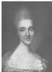
Dame, 27.5x22.5 ov., c.1778 (Warsaw, Muzeum Narodowe 129737). Lit.: Waniewska 1993, no. 107, as Polish sch. [cf. J. P. Bardou] ◊