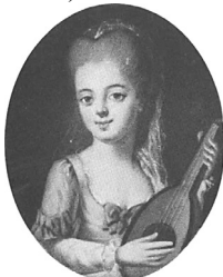
J.95.1203 Jeune femme avec guitare, 41x33 ov., c.1769 (Warsaw, Muzeum Narodowe, inv. NB 211. Radziwill at Nieborow). Lit.: Waniewska 1993, no. 102 φ