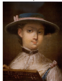
J.95.12295 Young woman in a white cap with blue ribbons, pstl/ppr, 45x35 (Wilanów, inv. Wil.1621). Lit.: Gutowska-Dudek 2019, pp. 148f repr., as style of Rotari φ