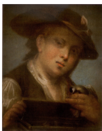
J.95.1192 Jeune homme, pstl/pchm, 53x43.5, c.1796 (Warsaw, Muzeum Łazienki Królewskie) φ