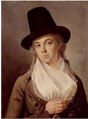
Claude-Étienne-Henri-Charles de BONS (1765–), pstl, 50.5x42 ov., 1789 (Lausanne, musée historique, inv. 32.19)

Louise-Marie Berdez-BARNAUD, pstl/pchm, 62x47, 1793 (Winterthur, Museum Oskar Reinhart am Statgarten). Lit.: Winterthur 2001, p. 25 ☐