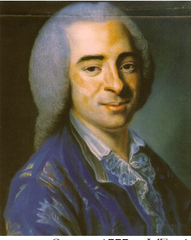
~grav. Coron 1777, L'Esprit des journaux , .IX.1777; Journal des sciences , 1777, p. 559f

J.5544.116 Homme en habit noir, orné de fleurs, pstl, 60x50.5, sd "Naudin/avril 1757" (Blois, Pousse-Cornet, 26.III.2022, Lot 42-1 repr., est. €150–200; Fontainebleau, Osenat, 30.IX.2023, Lot 117 repr., est. €500–600) φ