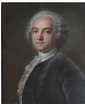
J.495.142 Un magistrat, pstl/ppr, 67.3x56.5, sd illisible/1742? (London, Christie's, 8.VII.2008, Lot 102 repr., attr., est. £10–15,000; London, Christie's South Kensington, 11.XII.2009, Lot 366 repr., attr., est. £5–7,000; London, Christie's South Kensington, 9.VII.2010, Lot 119 repr., attr., est. £2500–3500; London, Christie's South Kensington, 8.III.2011, Lot 158 repr., attr., est. £1000–1500, £2250; London, Christie's South Kensington, 21.VI.2011, Lot 250 repr., attr., est. £1000–1500, £1750) [new attr.] φανσ