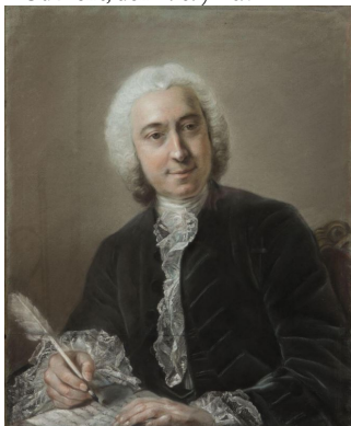
J.495.14 Homme en habit noir, pstl/ppr bl./toile/châssis, 55.0x45.5 (France PC; Monaco, Christie's, 30.VI.1995, Lot 112 repr., entouragement de La Tour; PC) [new attr., ?] Φανσ