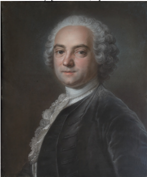
J.495.142 Un magistrat, pstl/ppr, 67.3x56.5, sd illisible/1742? (London, Christie's, 8.VII.2008, Lot 102 repr., attr., est. £10–15,000; London, Christie's South Kensington, 11.XII.2009, Lot 366 repr., attr., est. £5–7,000; London, Christie's South Kensington, 9.VII.2010, Lot 119 repr., attr., est. £2500–3500; London, Christie's South Kensington, 8.III.2011, Lot 158 repr., attr., est. £1000–1500, £2250; London, Christie's South Kensington, 21.VI.2011, Lot 250 repr., attr., est. £1000–1500, £1750) [new attr.] φανσ