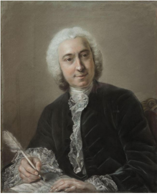
J.495.14 Homme en habit noir, pstl/ppr, 55.0x45.5 (France PC; Monaco, Christie's, 30.VI.1995, Lot 112 repr., entourage de La Tour; PC) [new attr., ?] Φανσ