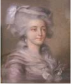
Coutances, v. Barruel-Beauvert

~cop., pstl, 40x30 (Carcassonne, Jacques Deleau, 7.XI.2009, XIX e , inconnue, est. €150–200) \varphi