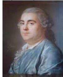
Un chevalier de Saint-Louis, pstl, 53.5x42, sd 1762 (Paris, musée national de la Légion d'honneur. Château Thierry, Renard-Giulioti, 14.III.2004, repr., est. €5000; don de la Société des amis du musée 2004) ◊

larger image Homme, pstl, 48x39, sd “LeNoir/p t 1762” (Swiss PC) ◊