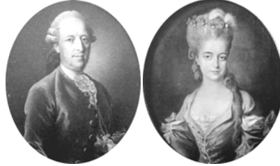
LOUIS XVI, a/r Duplessis [q.v.]