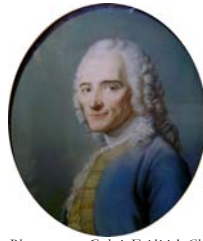
~cop., pstl, 58.5x47.5 (Paris, Drouot, Beaussant-Lefèvre, 27.X.2009, Lot 22 repr., est. €800–1000, €1600) ◊

=?pstl (Lyon. Baron Vitta). Lit.: Dorbec 1905, n.r. ~cop. [?a/r Lenoir or his source], pstl, ov. (Galerie Frédéric Chanoît 2003, as Lenoir, Salon de Saint-Luc 1764). Lit.: Jeffares 2006, p. 591biii ◊