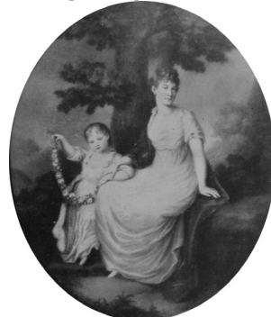
J.437.156 ~version, pstl (Rome, Palazzo di Venezia) φβ