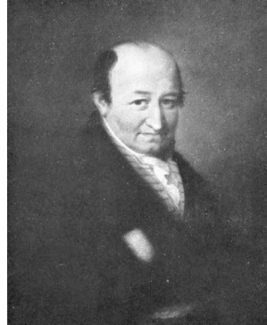
J.437.1705 Herr mit weißer Zopfperücke, pstl/ppr, 33x28, sd verso 1790 (Rudolstadt, Wendl, 27–30.X.2021, Lot 3458 repr., est. €150) \phi