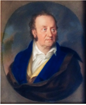
J.437.134 Herr; & pendant: J.437.135 Frau KUCHENREUTHER, 2 pendants, pstl, 43x25, sd 1790 (Frankfurt, Arnold, 7.IX.2002, Lot 799 repr., est. €600, €300) φ