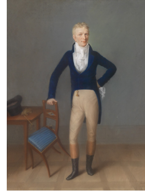
J.437.1731 Herr, pstl, 37x31, s "Kreul" (Lyon, De Baecque, 19.VI.2018, Lot 413 repr., est. €500–800) \phi