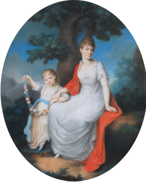
J.437.16 G. R. VOGEL, pstl, sd "Kreul, 1799" (acqu. 1946 for Führermuseum, Linz-Nr 3193; restituted 1948, Munich CCP, Mü-Nr 25483; Otto Gänsler, Gräfelting)