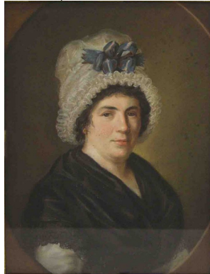
J.437.1882 Dame, pstl, 49.5x39.5, s ✓ Kreul (Köln, Van Ham, 16.V.2019, Lot 1041 repr., est. €2–3000) Φ