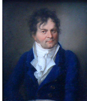
J.437.169 Herr (Nürnberg, Städtische Galerie). Lit.: Brieger 1921, repr. p. 238 \Phi