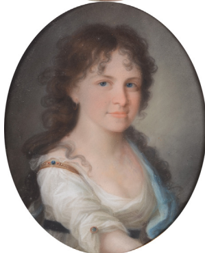
J.437.148 Philipp SAINT-ANDRÉ, pstl, 34x28, s "Kreul", ?1830 (Amsterdam, Sotheby's, 19.II.2003, Lot 451 repr.) φ