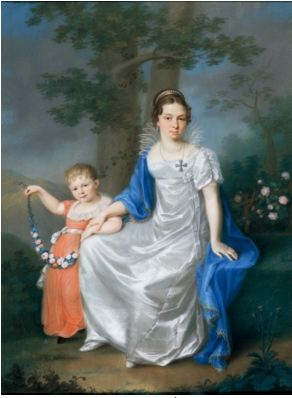
J.437.158 ~repl., pstl/pchm, 84x69, sd \wedge "Kreul pinxit" (Maureen, Marchioness of Dufferin and Ava; London, Christie's, 25.III.1999, Lot 340 repr., est. £500–1000, £2800. Hamburg, Stahl, 27.XI.2010, Lot 22 repr., inconnue, est. €2500) [new identification] \phi