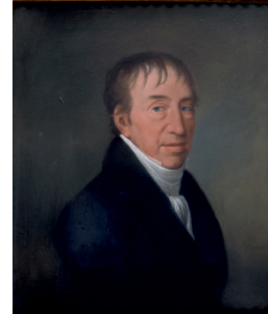
J.437.1732 Herr in blauem Rock, pstl/pchm, 46x37.5 (PC 2021; Berlin, Bassenge, 1–3.XII.2021, Lot 6699 repr., est. €600) [new attr., ?] \phi av