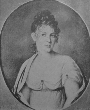
J.437.163 ~variant, 35x31 ov., s "Kreul p." (Ament, Bamberg; Frankfurt-am-Main, Bangel, 1894, Lot 136a repr.) \Phi