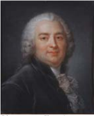
larger image