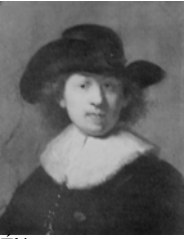
Eléazar SWALMIUS (1582–1652), pasteur, pstl/crt., 56x46, s “Cl. Hoin” (Dijon, mBA, 4493. Don Société des Amis du Musée 1960). Exh.: Dijon 1961, no. 116; Hoin 1963, no. 66, pl. XXII. Lit.: Quarré 1958, p.83 repr.; Quarré 1964, p.252; Dijon 1972, no. 16. A/r Rembrandt pnt. (duc d’Orléans) Φ