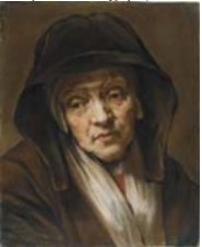
Femme âgée, pstl, 44x36 (Dijon, musée Magnin, 1938 DF 513. Magnin; acqu. p.1922; Legs Maurice Magnin 1938). Exh.: Hoin 1963, no. 65. Lit.: Cat. 1938, no. 513; Rosenberg 1987, fig. 48. A/r Rembrandt pnt., sd 1654 (Hermitage) φ