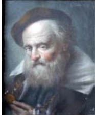
Tête d'homme barbu, ¾ à dr., 38.5x30.5, s v "C de Hoin" (Louvre RF 41362. [=?F. de Ribes Christoffle; Paris, Petit, 10–11.XII.1928, Lot 37 n.r.]; Paris, Drouot, Ader, Picard, Tajan, 4.XI.1980, Lot 77, fr3800) ◻