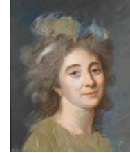
Femme, pstl, 58x45 ov. (Versailles Enchères, Perrin-Royère-Lajeunesse, 10.VIII.2006, Lot 65 n.r., attr., est. €2-3000)