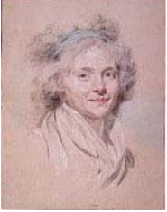
Jeune femme, pstl, 40.9x32.3 (Langres, musée d'Art et d'Histoire, inv. 872.1.15, réserve, musée du Breuil. Dijon, M e Guyot, 1872, Lot 183, Fr105; acqu.). Exh.: Hoin 1963, no. 53. Lit.: Vergnet-Ruiz & Laclotte 1962, n.r.; Portalis 1900, repr. Ⓚ