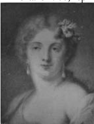
Jeune fille, pstl, 39.6x34.6 (Paris, ENSBA, inv. PM 2837. Don Mathias Polakovits) Ⓚ