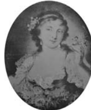
Jeune femme: effet de lumière, 40x31, sd 1814 (Paris, Drouot, 31.III.1914, Lot 33 repr.) ◻