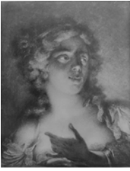
Allégorie de l'Automne, en buste, la tête légèrement penchée à g., portant un corsage blanc orné de deux roses, des raisins à la main dr., deux bouquets piqués dans ses cheveux, 45x38 (Dijon, mBA, 2899. Don Mme Lebon 1927). Exh.: Hoin 1963, no. 55. Lit.: Dijon 1972, no. 14 n.r. Ⓚ