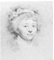
Femme, pstl/ppr, 30.9x24 (Tours, mBA. Legs Foulon de Vaulx). Exh.: Hoin 1963, no. 54