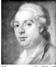
Homme, pstl, 59x47 ov. (comtesse d'Eugny 1935). Exh.: Copenhague 1935, no. 269 n.r.