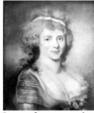
Jeune femme, pstl; & pendant: Jeune femme tenant un panier de fleurs et de raisins, pstl (Paris, 22.VI.1921, Fr4850)