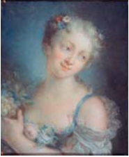
Tête de jeune femme au ruban bleu, cr. clr, esquisse, 49.5x38.2 (Dijon, mBA. Dr Laloge). Exh.: Hoin 1963, no. 76, pl. XVII Ⓚ