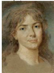
Femme en robe bleue (Versailles, 20.VI.2004, Lot 24 repr., attr.) [v. Éc. fr.]