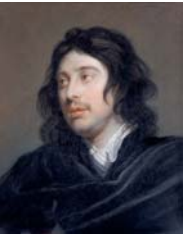
Homme, a/r Jakob Van Oost, pstl/crt., 55x45.5 (Dijon, mBA, 4494. Don Société des Amis du Musée 1960). Exh.: Hoin 1963, no. 64. Lit.: Quarré 1964, p. 252; Dijon 1972, no. 15 Φ