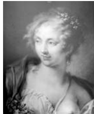
Tête de jeune femme au ruban bleu, pstl, esquisse, 49x40 (Dr François Baron, Dijon, 1963). Exh.: Hoin 1963, no. 46 n.r.