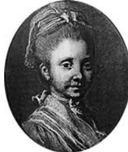
Jeune femme au ruban blanc, pstl, 59x48 (Paris, Drouot, Tajan, 27.VI.2001, Lot 151 n.r., attr., est. Fr12,000)