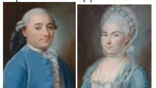
Homme en habit bleu; & pendant: dame, pstl, 42x34 (Zurich, Koller, 1.XII.2010, Lot 6514 repr., est. SwFr2-3000) φ