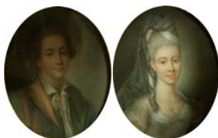
Gentilhomme; & pendant: épouse, pstl, 47x39 (Chaumont, Hôtel des centes de la Haute Marne, A. Du villier, 18.VII.2009, €2250)