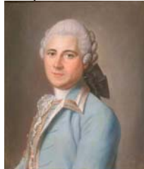
Jeune prince en habit gris, manteau bleu, pstl/vl, 45x37 (Neuilly, Aguttes, 9.XII.2009, Lot 48 repr., est. €1500-2000; Neuilly, Aguttes, 7.VI.2010, Lot 62 repr., est. €1000-1200) φ