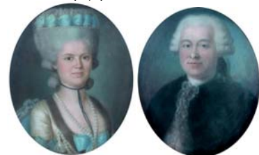
Homme en habit brun avec brandebourgs; & pendant: épouse en bonnet au ruban rose, pstl, 38x30 (Lille, Hôtel Alliance, Xavier Wattebled, 4.XI.2011) φ