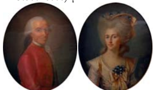
Een voorname heer; & pendant: een elegante dame, pstl/ppr, 46x38 (Amsterdam, Glerum, 14.VI.2010, Lot 94 repr., est. €1500-2500, b/i) [cf. Saint-Michel] φ