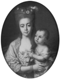
Famille, pstl, 97x80 (Monaco, Sotheby's, 17.VI.1988, Lot 1089 repr., attr. Valade; Paris, Drouot, Cornette de Saint Cyr, 30.I.1991, Lot 18 repr., Éc. fr.) \Phi