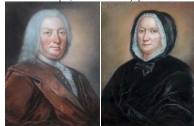
Homme; & pendant: Dame, pstl, 54x44 ov. (Paris, Drouot, Delvaux, 29.VI.2011, Lot 74/73 repr.) φ