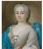
Homme en habit rouge; & pendant: dame avec fleurs au corsage, pstl, 61x51 ov. (Madrid, Goya Subastas, 21.III.2010, Lot 141 repr., est. €4500-6000) φ