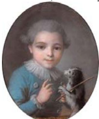
Homme; & ?pendant: femme à la guirlande de fleurs, pstl, 58x46 (Galerie Gismondi, Paris, Bruxelles, Pierre Bergé, 19-20.V.2009, Lot 399 repr., est. €1800-2200) φ