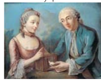
Galant scene med ungt par i rokokodragter, den unge herre gør kur, pstl, 84x68 (Bredgade, Bruun Rasmussen auktion 739, 1–11.III.2005, Lot 1641 repr., Éc. fr. XVIII e , est. €1050–1300) \Phi