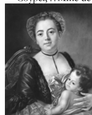
Femme et ses deux enfants dans un intérieur, pstl, 37.5x28 (Paris, Drouot, Champetier de Ribes, 23.II.1965, H550)