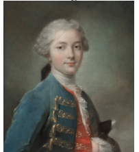
J.9.2962 Homme en robe de chambre bleu rayé, pstl/ppr, 55x45, c.1755 (Dronero, Museo civico Luigi Mallè, inv. 87) φ