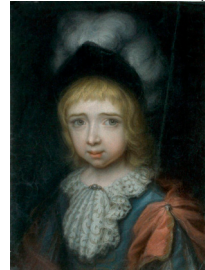
J.9.2976 Officier subalterne, de ¾ à g., pstl, 57x43.2 (Grasse, musée d'Art et d'Histoire de Provence)

J.9.2977 Jeune homme, pstl, c.1760 (Ieper, Merghelyneck Museum). Lit.: Dendooven 2001, repr. p. 21 lower right φ