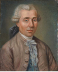
1.9.292 Homme à la tabatière, pstl/ppr, 71.1x56.2 (Bloomington, Indiana University Art Museum, inv. 85.72.1.. Leland G. Howard, Rockville, Indiana, by 1985; don 1985, as Vigée). Exh.: Gifts to the Art Museum, 1985–1989 , Bloomington, Indiana University Art Museum, 16.VI.–19.IX.1989; About face: two thousand years of portraiture at Indiana University , Bloomington, Indiana University Art Museum, 29.III.–14.V.2000 [cf. La Tour] \Phi

1.9.2919 Homme, pstl, 45x37 (Besançon, mBA, inv. D.5484). Lit.: Chatelain 2018, no. 246 \Phi