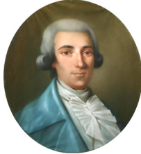
J.9.296 Jeune homme en habit bleu, gilet rouge, pstl/ppr, 61x50.5, c.1760 (Dronero, Museo civico Luigi Mallè, inv. 86) φ

J.9.2958 Inconnu, pstl/ppr, 53x48 ov. (Dijon, musée Magnin, inv. 1938 DF 1043. Legs Magnin 1938) φσ