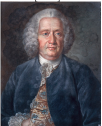
J.9.2947 Homme, de face, regardant vers la dr., en habit gris-bleu, gilet à fleurs dans lequel il a passé la main dr.; perruque poudrée; fond gris, pstl/ppr, 64.5x54, sd ← ".../1762" (Dijon, mBA. Acqu. 1869–1883). Exh.: Dijon 1972, no. 35 n.r. Lit.: Jeffares 2006, p. 275Cii, attr. Lallié [?attr.] Φσ