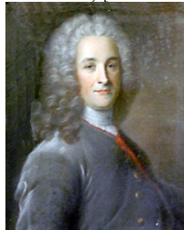
1.9.2932 Enfant de la Comédie-Française, regardant à g., pstl, ov. (Châteauroux, musée-hôtel Bertrand, inv. 54-41-12) \Phi

1.9.2929 Homme en perruque régence, habit gris à passementeries rouges, pstl, 59x46 (Chalais, abbaye royale, fondation Jacquemart-André, inv. S1083, ?Tocqué. Leroy, Versailles; acqu. 26.II.1911) [cf. Lefèvre] \Phi\sigma