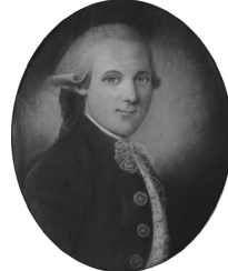
J.9.297 Boy, pstl/ppr, 61x44 (Gloucester, Massachusetts, Beauport, Society for the Preservation of New England Antiquities) φ

J.9.2968 Homme en habit rouge, pstl/ppr, 57x46 ov. (Gloucester, Massachusetts, Beauport, Society for the Preservation of New England Antiquities) φ