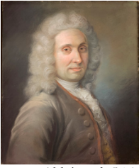
J.9.2941 Abbé, pstl, 56.3x45.8 (Compiègne, musée Antoine Vivenel, inv. Let.4005.02. Don Mlle Breton 1933) φ