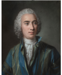
J.9.2964 Jeune homme en buste, pstl, 55x45 (Évreux, musée, inv. 8089) φ