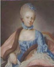
Jeune dame, pstl/ppr, 37.5x24.4, c.1680 (Leiden, Stedelijk Museum de Lakenhal, S197). Exh.: Schiedam 1959 ◊

Onbekende vrouw met handschoen in hand, pstl, 77.5x62, c.1770 (Delft, Prinsenhof Museum, B 3-70. Dep. Stichting familie-archief Van der Goes van Naters) ◊