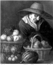
Young girl, pstl/ppr, 24.3x19.8 (Cambridge, Fitzwilliam Museum, PD.119-1964. P. & D. Colnaghi; Sir Bruce Stirling Ingram; London, Sotheby's, 1.XII.1964, Lot 80, withdrawn; legs 1964). ?18 th century copy of 17 th century portrait, ?Flemish

Crescent –.VII.2009). Attr. Carriera, Hoare [??]