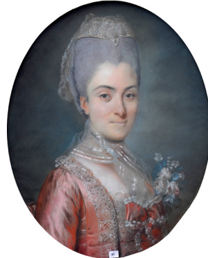
J.259.143 Dame au bouquet de roses, pstl, 60x50 ov., sd ← "Davesne/pinx t 1770" (Doullens, Herbette, 16.III.2008, Lot 45 repr., est. €2000–2500. PC Milan; Paris, Salle Laffitte, Artemisia, 13.XII.2012, Lot 143 repr., est. €10–12,000; Paris, Drouot, Artemisia, 22.II.2013, Lot 99 repr., est. €4–6000; Paris, Salle VV, rue Rossini, Artemisia, 20.IV.2013, Lot 10 repr., est. €2–4000). Lit.: Gazette Drouot , 7.III.2008, p. 209 φσ