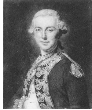
J.259.138 [André] PUJOS [(1738–1788)], peintre de l'Académie royale de peinture & sculpture de Toulouse, m/u, Salon de Saint-Luc 1774, no. 50