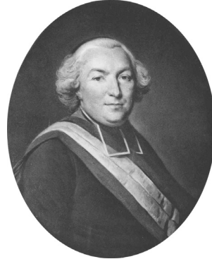
J.259.141 Un député du clergé à l'Assemblée nationale, pstl, 65x55 ov., sd "Davesne pin. 1791" (Paris, Drouot, Lair-Dubreuil, 21–22.II.1923, Lot 37 n.r., ff1900; Louis Dumoulin 1927; Paris, Jean Charpentier, Baudoin, 25.VI.1937, Lot 18, ff1550. Rouen, Palais des consuls, Fournier, 3–4.XI.1975, Lot 168 repr., ff21,500). Exh.: Paris 1927a, no. 13, pl. I.LXXXVIII-129; Paris 1931b, no. 103 n.r. Lit.: Ratouis de Limay 1946, pl. I.VII/86 φ