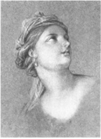
~4 autres têtes. Lit.: Lefrançois 1994, P.290–293 n.r.