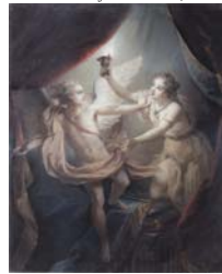
L'éducation de la Vierge, ou l'éducation douce et insinuante donnée par une sainte, pstl/ppr, 57x46, c.1738 (London, Christie's, 10.VII.2001, Lot 123 repr., est. £3-5000, £3525). Lit.: Lefrançois, P.168-9 ♂

L'Amour qui abandonne Psyché, pstl/ppr gr. bl., 82.0x65.0, sd "C. Coypel 1736" (Paris PC 1972; London, Christie's, 6.VII.1999, Lot 164 repr., est. £15-20,000. Didier Aaron 2000, cat. no. 8). Lit.: Monnier 1972, s.no. 46 n.r.; Lefrançois 1994, P.179 ♂