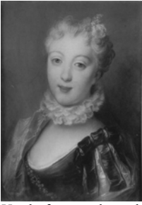
Head of an angel, cr. clr, pstl/br. ppr, 39.7x30.5 (London, Christie's, 2.VII.1996, Lot 221 repr., est. £4-6000, £5981) ♀