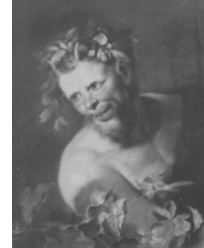
Homme (Paris, 11.VI.1990, Lot 34 repr., école de C. A. Coypel) [n. Éc. fr.]

Tête d'un satyr, pstl, 62.5x48.5 (London, 8.VII.1980, Lot 74 repr.) φ