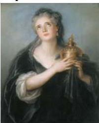
larger image