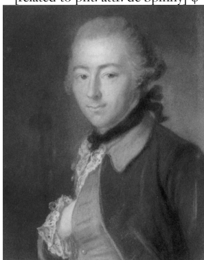
J.22.116 ~1/2 length, pstl (Amerongen). Lit.: Godet 1906, I, p. 199 repr. φ