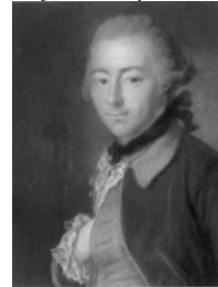
~1/2 length, pstl (Amerongen). Lit.: Godet 1906, I, p. 199 repr. \varphi