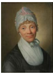
Frau mit offenem gepudertem Haar, pstl/ppr, 53x45, s ✓ "D. Coffe" (Bern, Stuker, 10.v.2001, Lot 1125 n.r.)