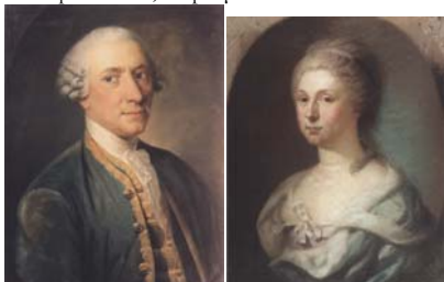
Man in a green coat with gold edging; & pendant: woman in a green mantle with white fur trimming, pstl/ppr (Moscow, GIM). Lit.: Перова 2006, clr pl. ♀