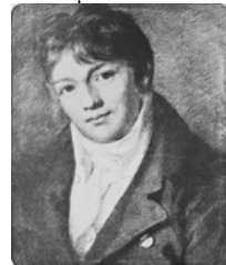
Cathrina Elisabeth KAULFUSS, pstl/ppr, 62x50 (Copenhagen, Bruun Rasmussen, 30.XI.1999, Lot 435 n.r., est. DKr2000, DKr4000)