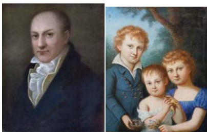
Carl Anton BLANCHARD (1768–1842), Maler, pstl, 55x43, 1792, inscr. verso "...dieser meinlieber Freund..." (Leipzig, Stadtgeschichtliches Museum, inv. XXVII/39) ♀