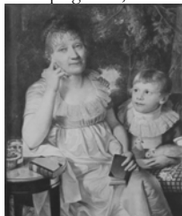
Carl Gottfried PETER, pstl/ppr, 43x35, 1804 (Leipzig, Stadtgeschichtliches Museum, inv. XXVII/120) φ