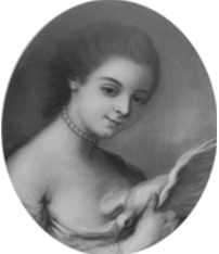
~cop., pstl, 44.5x36.5 ov. (Darmstadt, Hessisches Landesmuseum, inv. GK 972g. Schloß Richtof, Schlitz; Otto Hartmann Graf von Schlitz genannt von Görtz (1907–1977), don 1965; dep.: Schloß Bad Homburg 1962). Lit.: Ludwig 1999, pp. 263ff repr. \varphi