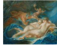
Deux dessins, d'une composition gracieuse, pstl, manière de Boucher (Paris, Helle, Glomy, 26.I.1767 & seq., Lot 84, 30 livres; Veroter)