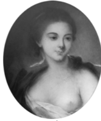
Tête, cop. a/r Boucher par Caresme, pstl (Paris, Grands-Augustins, 29.III.1763, Lot 66) [v. Caresme]