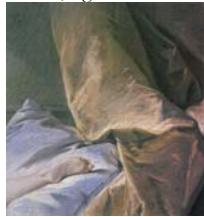
larger image

Étude de pied, 29.5x29 (Paris, musée Carnavalet, D.4353. Don Jules Maciet 1903). Exh.: Paris 1927a, no. 6 bis , no pl.; Boucher 1932, no. 107; Boucher 1964, no. 56. Lit.: Nollac 1907, p. 73; Fenaile 1925, p. 63; Ananoff 1966, no. 538, fig. 100 ◐