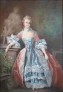
Jeune femme en Printemps, pstl/ppr, 46.5x37.3 (Dieppe, château-musée, inv. 934.2.20, attr. Legs Sancy-Lebon 1934) \Phi