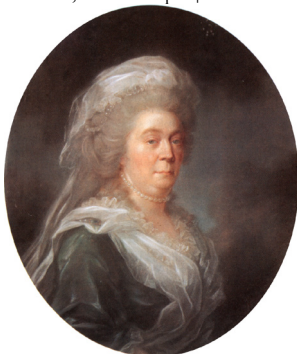
J.12.227 ~?repl., pstl, 33x26 (Schloß Monbijou 1939, as by Guido Bach; lost Potsdam .V.1945). Lost Art-ID 025313 n.r.