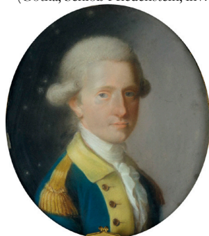
J.12.207 ~repl., pstl, 24x20.3 ov. (Weimar, SWKK, inv. KGe/00370) φ