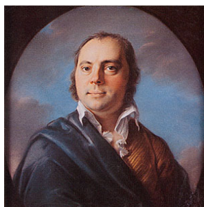
~grav. C. Barth (Singer, 94426)