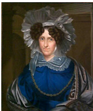
J.12.222 LUISE ELEONORE Herzogin von Sachsen-Meiningen, pstl, 35.5x28.5, inscr. verso : 1812 (Rudolstadt, Wendl, 12–15.VI.2024, Lot 3109 repr., est. €900) \phi