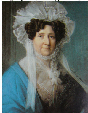
J.12.236 ? Sophie von RHAMM , half-length, full face, wearing blue dress and white bonnet, grey background, pstl, 34.2x27, 1834 (Royal Collection RCIN 452546, as of Herzogin Luise Eleonore von Sachsen-Meiningen) \phi