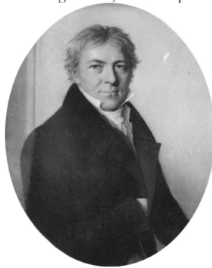
J.12.255 ~repl., pnt. (Hermann Lotz, Meiningen, 1904)