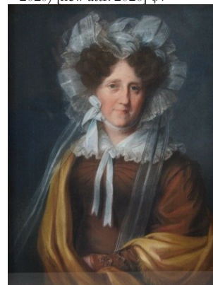
J.12.221 LUISE ELEONORE Herzogin von Sachsen-Meiningen, pstl, c.1820 (Meiningen, Schloß Elisabethenburg, 2004) φ