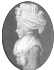
Enfant de la famille de GIJSELAAR, pstl/ppr, 13.6x10.9 ov., sd 1792 (Leiden, Stedelijk Museum de Lakenhal, S710) φ